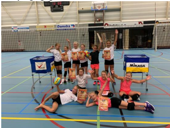
Dames 1 bedankt.